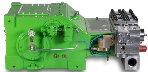
Abb. mit Umlaufventil/ picture with unloader valve